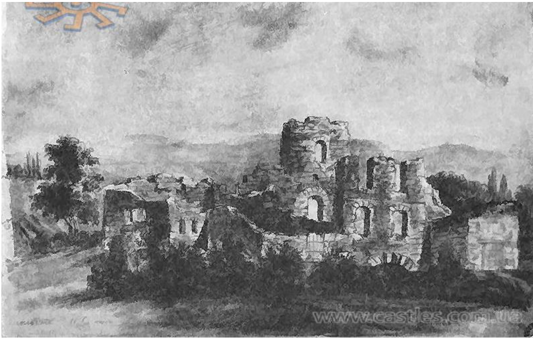
«Оборонний замок збудований в 1598 р. Яном Потоцьким, воєводою брацлавським. Зруйнований турками і козаками у 1651 р.. Тут була