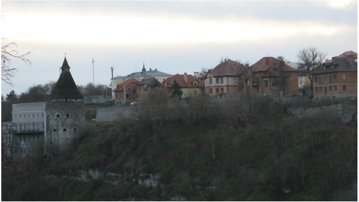
Ф 7 Новобудови північної частини вул. Довга.

Власники цих ділянок на старовинних фундаментах зводять ошатні оселі, частково дотримуючись вигляду будинків ХІХ ст.