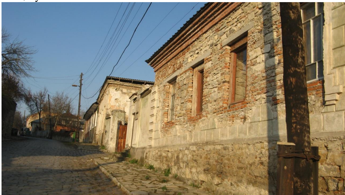
Ф.2 Будинки №15-15а.

Будинки № 15 – 15а – це давня шляхетська садиба, яка належала представникам польської кам'янецької знаті, згодом російському чиновництву Ф.2.