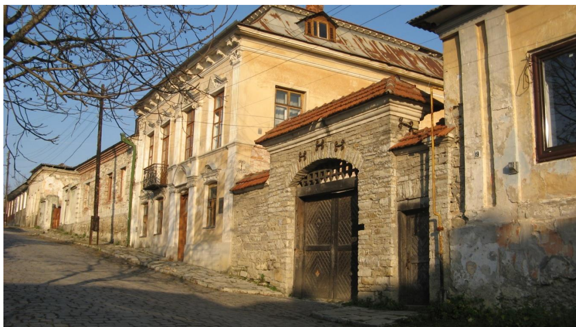
Ф 5 Брама між будинками №17 та №19.

Власниками садиби в ХІХ ст. був подільський шляхтич Г.Равич, потім католицькі монашки-візитки, деякий час знаходилася публічна бібліотека, казенна палата та міське поліцейне управління. Зараз садиба частково використовується під житло Ф.5.