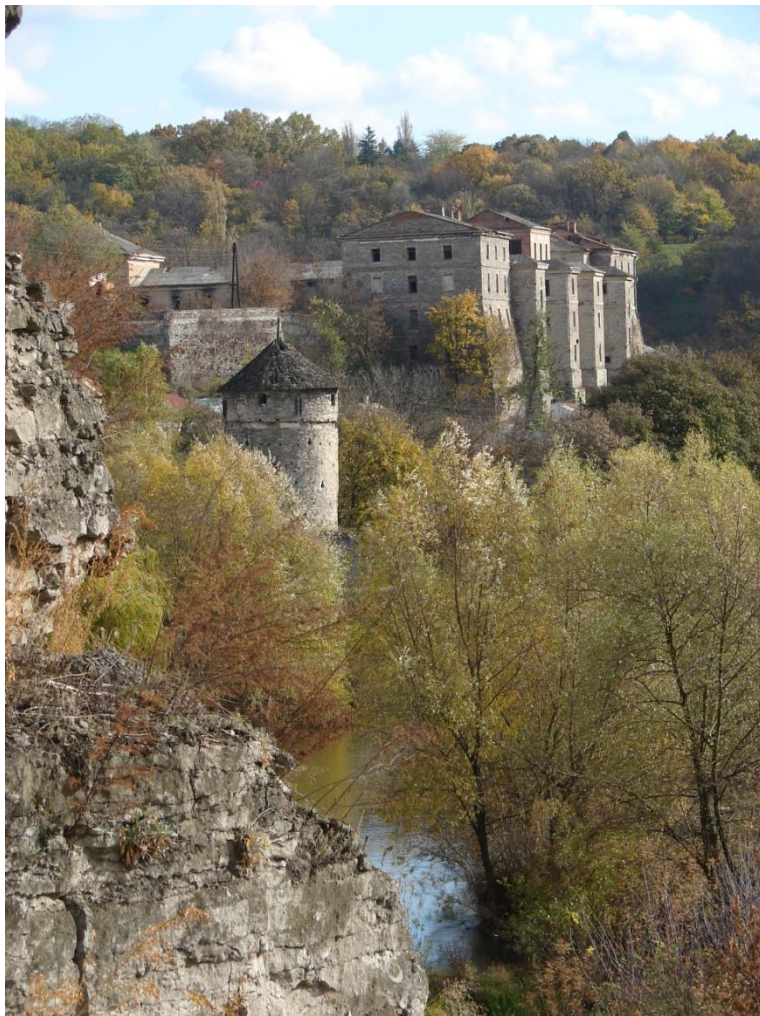
Ф 6 Казарми фортеці.

Вулиця Довга закінчується біля казарм фортеці (XVIII ст.), які розташовані на вулиці Руській. В давній час поряд знаходилась брама, яка закривала вихід на вулицю Довгу з долини р.Смотрич. На ніч брама замикалась Ф 6.