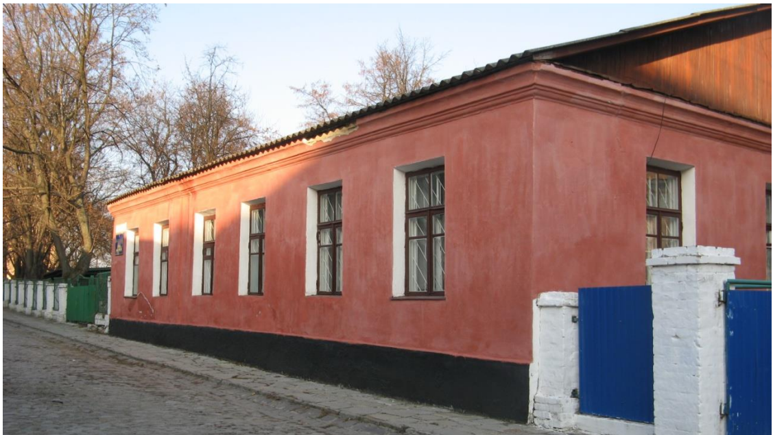
Ф 8 Буд. №3-Станція юних туристів.

Із матеріалів інвентарної справи на домобудівлю по вул. Довгій, 99 (в теперішній час Довга, 3) по «Податковій книзі» бувшої Міської Управи за 1917 р. будинок записаний за церковною громадою Ф 8.