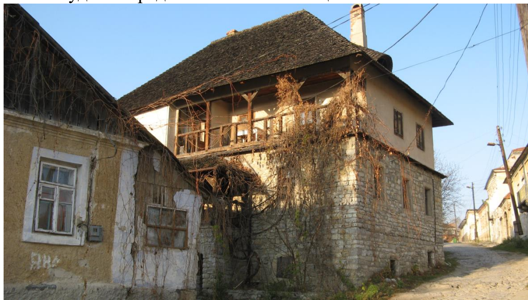
Ф.1 Будинок заможного вірменина - №12а.

Особливу увагу привертає будинок № 12а, (Ф.1) – цікавий зразок житлової забудови середньовічного Кам'янця.