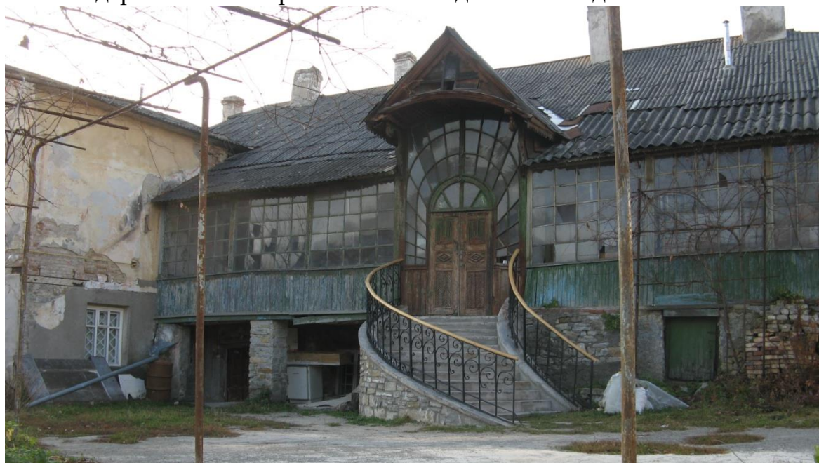
Ф.4 Дерев'яна галерея буд. №19, вид з двору.

Садиба має велике внутрішнє подвір'я, сад, розташований на двох терасах з підірними кам'яними мурами. Будинок № 19 різко контрастує зі своїм сусідом. Фасад позбавлений декору, але дворовий фасад гарно оформлений дерев'яною галереєю та віялоподібними сходами Ф.4.