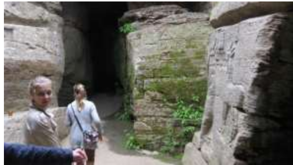
ф.6,6а Скельний храм з художніми барельєфами

Повертаємося до села та відвідуємо етнографічний та ужитково-мистецький музеї, а також музей «Панорама Буша 17ст.» (ф.7,7а,7б)