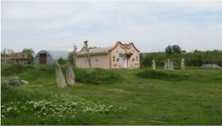
ф.5 Біля музею археології є