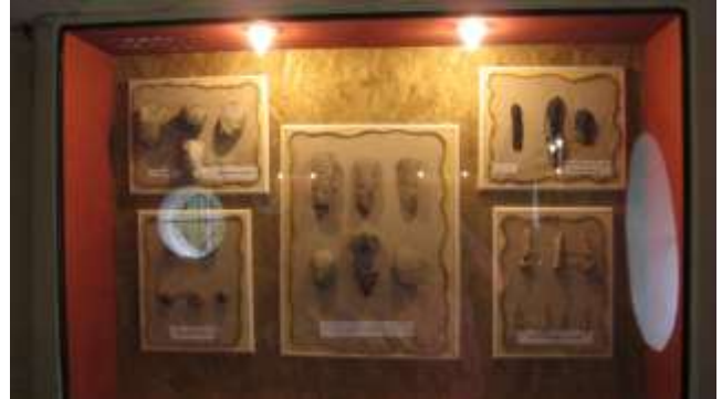
ф.16,16а В музеї трипільської культури

В 2004 р. на території заповідника в старовинній 130-річній хаті був створений музей побуту та етнографії. Тут зберігаються знаряддя праці, посуд, одяг, рушники, скриня, колиска, картини, ікони місцевого українського населення. (ф.17)