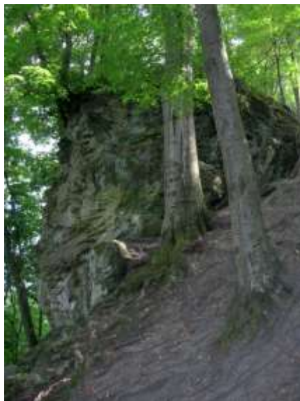
ф. 18,19,20 Фантастичні скелі Гайдамацького яру