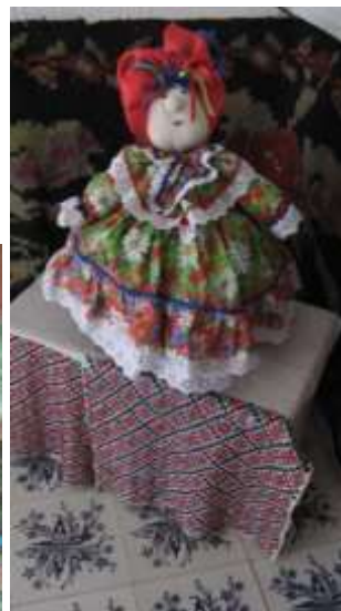
ф. 7,7а,7б В селі Буша 5 музеїв Їдемо на північ за 5км від Буші до с.

Гамулівка, де уздовж річки Бушанки знаходиться мальовничий каскад скель - Гайдамацький яр та Гайдамацька печера. По дорозі відвідуємо кладовище ХУПст (ф.8,9,9а).