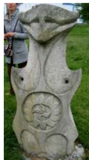
ф.15 Козаки – захисники Буша та Праматір роду козаків

Вже традиційно 14 жовтня на свято Покрови Пресвятої Богородиці на базі заповідника проводиться обласне козацьке свято «Степ та воля - козацька доля», на яке збирається козацтво Вінниччини, звучать козацькі пісні, влаштовуються змагання між козаками-побратимами. У 2004-2005 рр. проводились пленери художників-живописців Вінниччини, роботи яких також зберігаються у заповіднику.