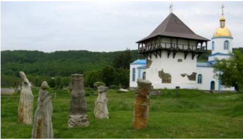
ф.13 Збережена башта