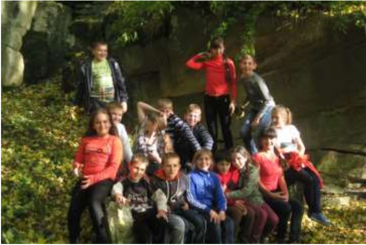
ф.8 В Гайдамацькому яру