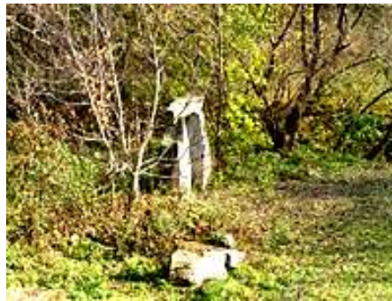
ф.9,9а Козацькі хрести на кладовище