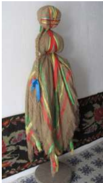
ф.17 З експозиції музею