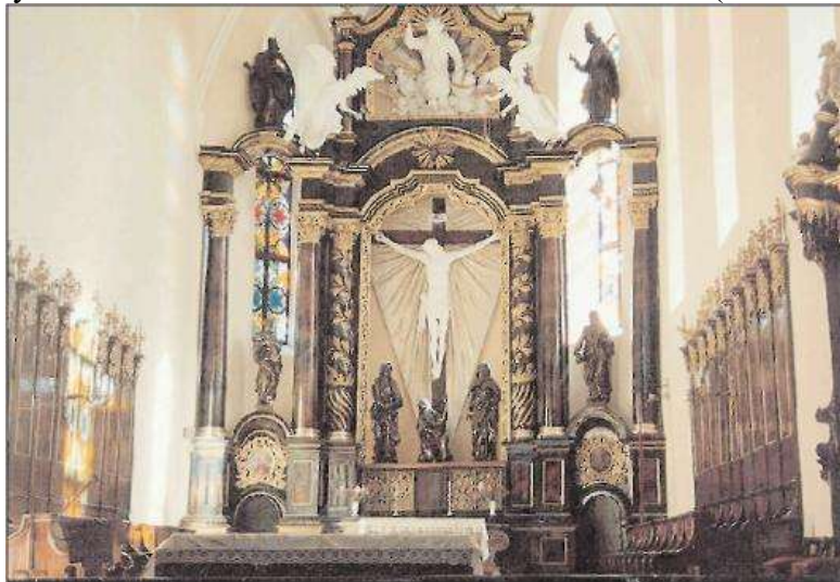
Пресбітеріум Петропавлівського костела.

«Алла, акбар, алла!» – несло над поневоленим містом, луною віддаючись від сірих скель, високих товтр. Повернувшись до Кам'янця поляки теж не прийняли чужих останків, а мінарет увінчали статуєю Богородиці, яку єпископ (єпископ) Микола Дембовський привіз з далекого Данціга (Гданська). Для виготовлення Мадонни використали сплав з міді і срібла, який називається дзвоною міддю. Хоч всередині статуя порожня, вага її досить значна, а довжина композиції 4,5 м. 10 травня 1756 р. дзвонили урочисто дзвони, гриміли фортечні гармати – Мадонна в ореолі зірок ступила на золоту кулю з півмісяцем і змією. Ця символіка запозичена з «Апокаліпсиса» Іоанна Богослова: «И явилось на небе великое затмение жена облаченная в солнце: под ногами ее луна и на голове ее венец из двенадцати звезд.» (глава 12, стих 1).