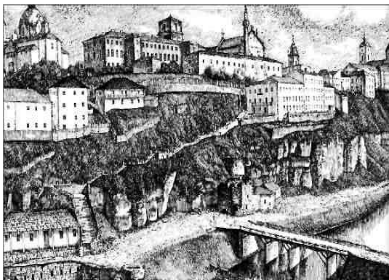
Вид на Старе місто з Польських фільварок.