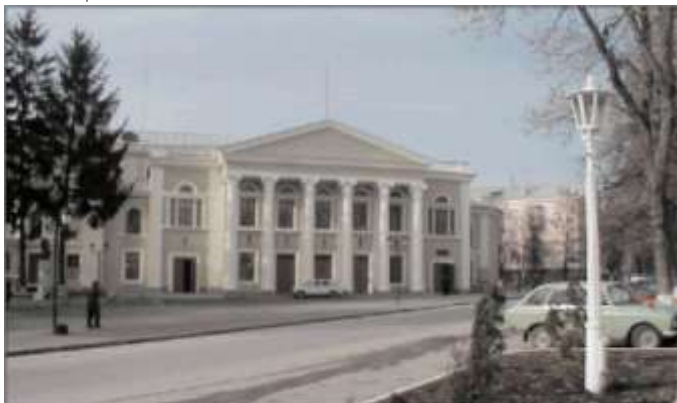
Міський будинок культури. Вул. Шевченка