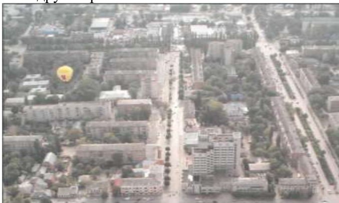
Новий план. Фото з повітряної кулі.

Якщо у Вас нема важких валіз і є бажання познайомитися з сучасним і минулим Кам'янця-Подільського - помандруємо разом.