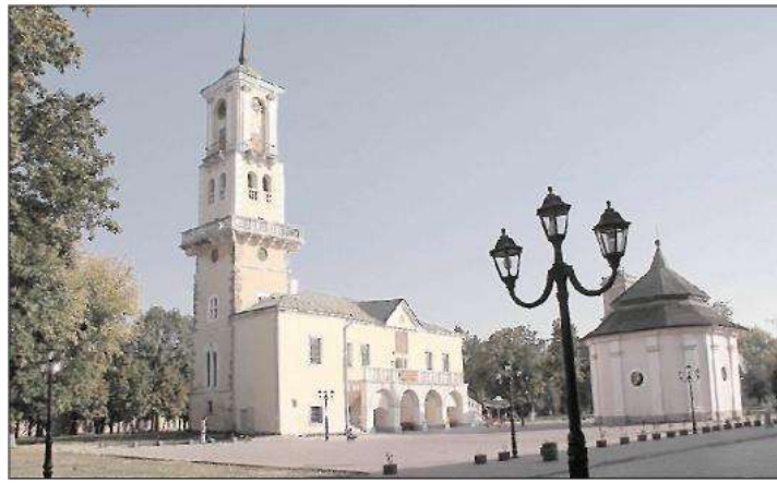
Площа Польський ринок і Вірменська криниця.

Легенда мовить, що одного разу після покарання він підвівся з лави, намочив у воді сорочку, викрутив і одягнув на себе. Мокра сорочка прилипла до посіченої спіни і, насичуючись кров'ю, на очах у присутніх зробилася багряно-червоною, як небо перед бурею. Устим, повернувшись обличчям до можновладців, крикнув: «Я ще повернуся!».