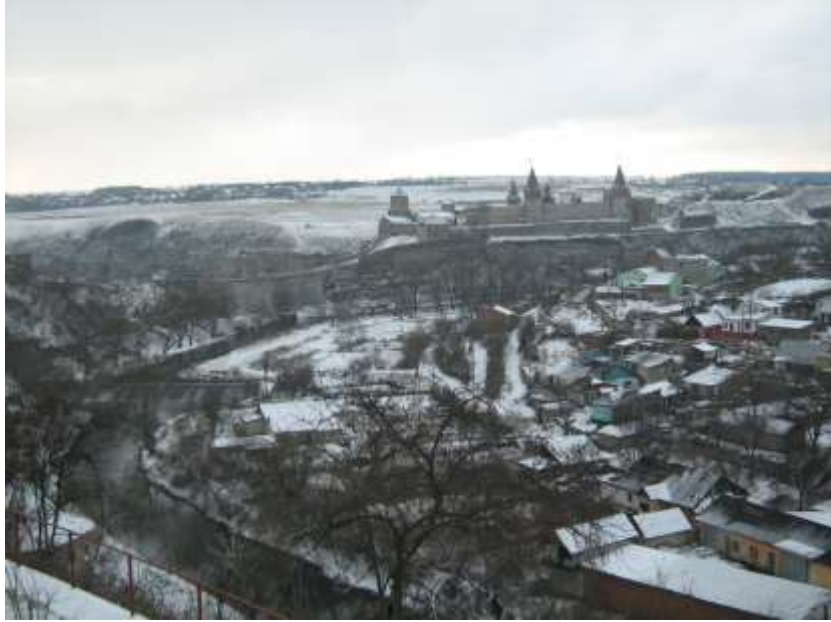
Вид на Старий замок та Польські фільварки зі сходу.

Оминаючи мальовничі товтри, прохолодного ранку потяг «Київ – Кам'янець-Подільський» підкочується до залізничних воріт «перлини Поділля».