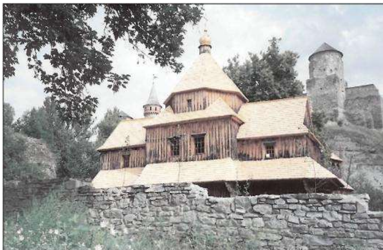
Дерев'яна Хрестовоздвиженська церква на Карвасарах.

Наша мандрівка продовжується. Старобульварним узвозом, минаючи Тринітарський костел, Вірменський бастион та Міську браму доходимо до Замкового мосту. Фортеця – ось вона, поряд, але вправний екскурсовод може Вам запропонувати довший шлях, не відмовляйтеся, навіть якщо дуже стомилися, не пошкодуєте.