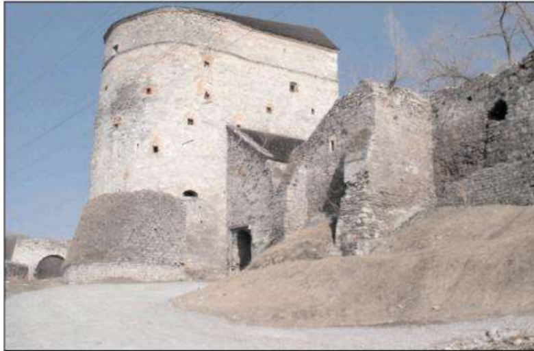
Кушнірська башта та Вітряна брама.