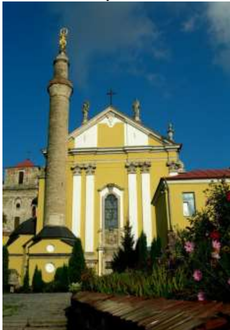
Мінарет біля Петропавлівського костела.

З дозволу князів Коріатовичів близько 1370 р. ченці-домінікани побудували Петропавлівський костел. У 1375 р. папа Григорій XI видав булу про створення Подільської католицької єпископії з центром в Кам'янці. Протягом кількох століть Кам'янець стає центром поширення католицизму на Поділлі.