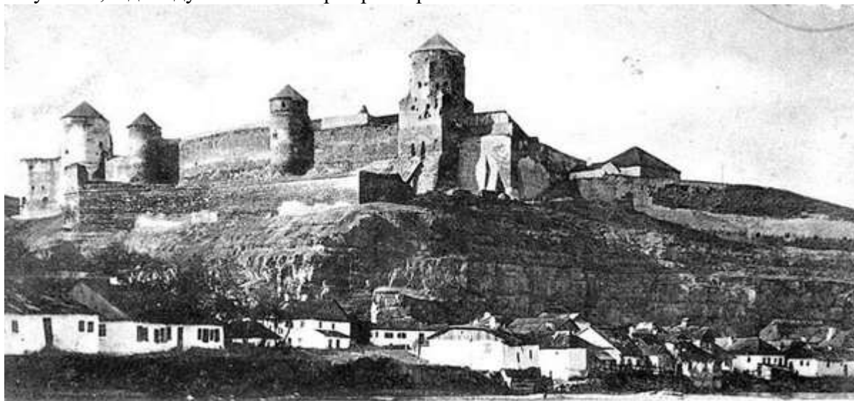
Старий замок з півдня. Фото кінця XIXст.

Славу неприступної цитадель зберігала століттями. Об її мури розбивались кляті ординські хвилі, замок не підкорявся ні молдаванам, ні волохам, стояли під її стінами війська Богдана Хмельницького, його сина Тимоша, І.Богуна, Джержалії. Імена будівничих фортеці – на мурах, палених вогнем: Каміліус, Йов Претвич, Теофіл Шомберг, Арчибальд Гловер, Христіан Дальке, Ян де Вітте, Станіслав Завадський. Лише двічі вона була здобута: в 1393 р. штурмом здолав замок литовський князь Вітовт, і у 1672 р. – турки, маючи перевагу в силі майже в 100 разів. Звитягу місту склали 12 днів його оборони і день останній, коли на одному з бастионів фортеці стався вибух. Досі цей вибух пояснюють недбальством жовнірів у пороховому льосі, відчайдушністю майора артилерії Геклінга.