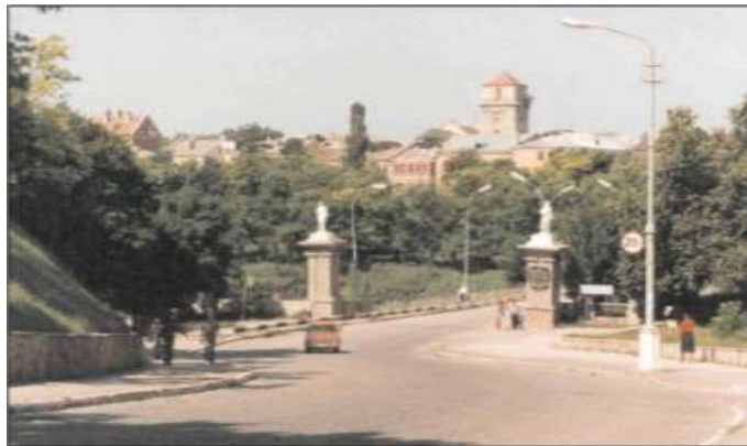
В'їзд на Новопланівський міст. Фото кінця ХХст.

З давніх-давен жили тут улличі, тиверці, гніздилися поселення мисливців та хліборобів, з часом і купців, відомих не тільки в своєму Пониззі, а й за морями – звідки ж бо на околицях Кам'янця римські та візантійські монети? На картах античного географа К.Птолема (II ст. н.е.) розповідає про город Клепідава, що на латині – «Місто на камені». Але чи Кам'янець то на Поділлі?