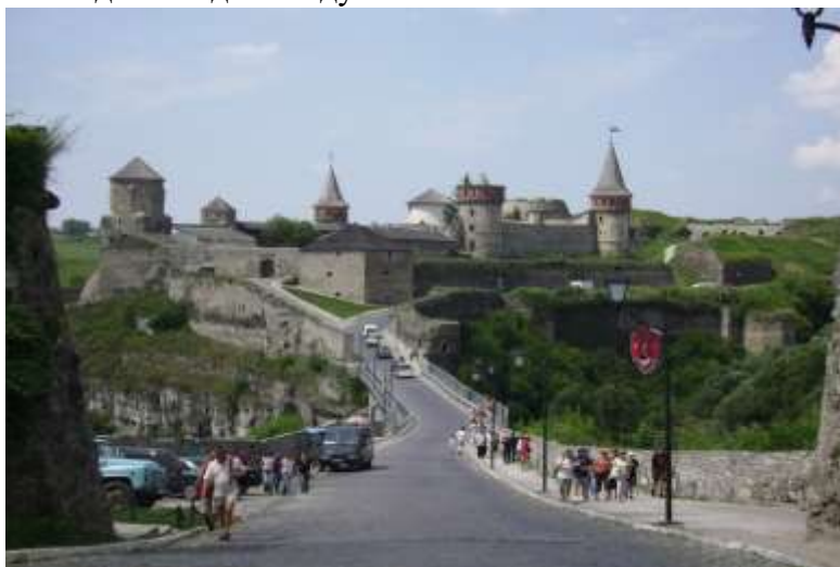
Старий замок. Вид з боку Старого міста

Якщо Ви себе вважаєте справжнім шанувальником історичних пам'яток, то варто розпочати огляд міста з Верхньої та Нижньої Польської брами. Вулиця Зарванська, на північному сході Старого міста, закінчується біля Кушнірської башти на колишньому Руському ринку. До речі «зарванцями» поляки називали жебраків, брудних, неохайних людей. Уявляєте, якою була ця вулиця в середньовіччя і хто тут мешкав.