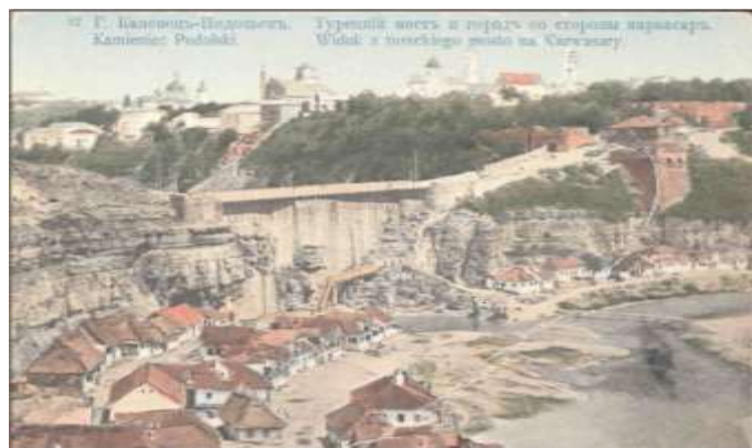
Турецький міст збоку Карвасар. Фото кінця XIXст.

Ще у XVI-XVII ст. Кам'янець був найбільшим торговим центром на Поділлі. У місті традиційними були 3 ярмарки, щотижня відбувались торги, існувала постійна торгівля. Неподалік фортеці збудували постійні двори і склади для товарів, якими користувались приїжджі купці та подорожні. Від цих «караван-сараїв», доречі, і пішла назва передмістя – «Карвасари». За обсягом зовнішньої торгівлі Кам'янець суперничав зі Львовом. Торговельне життя вирувало на Польському, Вірменському, Руському ринках, там можна було купити товари з Франції, Чехії, Туреччини, Персії. Для перевезення товарів торговці постійно наймали кам'янецьких фурманів, які добре знали дорогу, мови і звичаї інших народів.