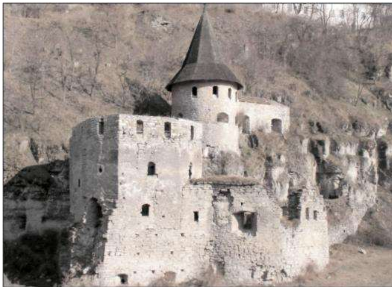
Башти Нижньої Польської брами.

самої води, під невисокими, в цьому місці, скелями три башти, фрагменти стін. Це була могутня оборонна система, фактично ще одна фортеця що складалася з п'яти башт, з'єднаних між собою мурами, які перетинали каньйон ріки. Три башти були розташовані на правому березі, а дві на лівому.